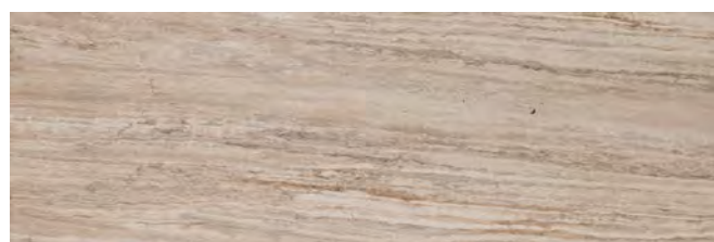
MMHR Allmarble Travertino20 40x120

Conforme • According to • Conforme • Gemäß • Conforme • Соответствует UNI EN 14411 - G B1a